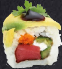
TEKKA DELUXE 8 Stück Thunfisch, Tobiko, Gurke, Mayo, on top mit Avocado, Koriander und Teriyakisauce 14.20