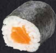
MAKI SAKE Lachs 7.60