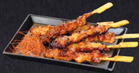
TERIYAKI STICKS in Teriyakisauce mariniertes Chicken 6 Stück 8.30