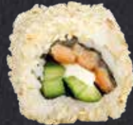
SALMON ROLL gebratener Lachs, Gurke, Mayo 11.10