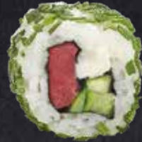
TEKKA CHIZU ROLL Thunfisch, Gurke, Frischkäse 12.60