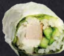
SPRING ROLL CHICKEN