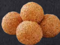
SESAMBÄLLCHEN 4 Stück

Frittierte Sesambällchen mit einer süßlichen Füllung, wahlweise mit Honig oder Nutella zum Dippen