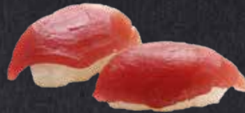
NIGIRI TEKKA Thunfisch 6.50