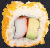
SURIMI ROLL Surimi, Avocado 10.60