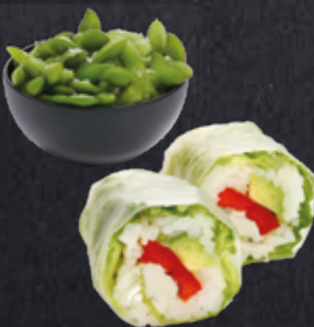
MITTAGSANGEBOT 4 ✓ 1 Spring Roll Veggie (6 Stück) 1 Portion Edamame 7,80