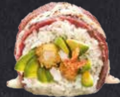
BEEF DELUXE 8 Stück gebackene Garnele, Avocado, Ponzu-Mayo, on top mit Pastrami, Ponzu-Mayo und Sesam 14.20