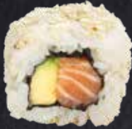
SAKE ROLL Lachs, Avocado 11.10