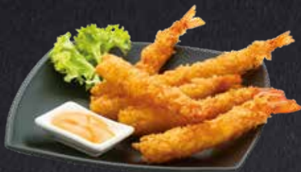
EBI STICKS gebackene Garnele, Dip nach Wahl 6 Stück 8.90