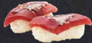
NIGIRI TEKKA TERIYAKI Thunfisch, Teriyakisauce, Sesam 7.00