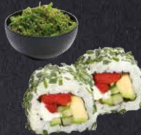
MITTAGSANGEBOT 2 ✓ 1 Veggie Roll mit Schnittlauch (8 Stück) 1 Algensalat (kleine Portion) 9,30