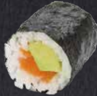
MAKI SAKE AVOCADO Lachs, Avocado 8.30