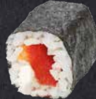
MAKI PAPRIKA ✓ rote Paprike, Frischkäse 6.20