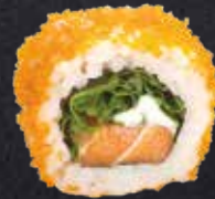
SAKE RUCOLA ROLL Lachs, Rucola, Frischkäse 11.40