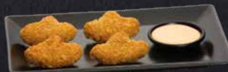
CHEESY AVOCADO BITES ✓ Frittierte Avocado mit Cheddar im Teigmantel und Dip nach Wahl 4 Stück 4.90