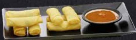
FRÜHLINGSROLLEN ✓ Dip nach Wahl 8 Stück 5.70