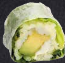
SPRING ROLL AVOCADO ✓