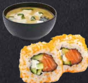
MITTAGSANGEBOT 5 1 Sake Chizu Roll mit Tobiko on top (8 Stück) 1 Miso Suppe 10,40