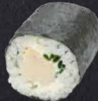
MAKI CHICKEN Chicken, Frischkäse, Schnittlauch 7.60