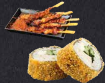
MITTAGSANGEBOT 3 1 Crispy Chicken (8 Stück) 3 Teriyaki Sticks 11,40