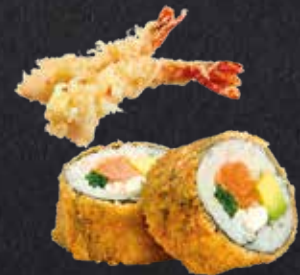
MITTAGSANGEBOT 6 1 Crispy Sake (8 Stück) 3 Ebi Sticks 11,40