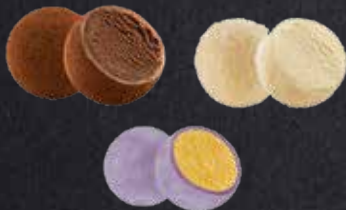
MOCHI MIX 3 Stück

Mochi Mango Maracuja, Mochi Schokolade und Mochi Kokos