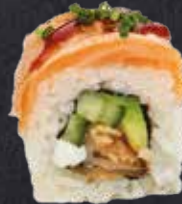
FLAMED SAKE DELUXE 8 Stück gebratener Lachs, Avocado, Gurke, Frischkäse, on top flambierter Lachs, Teriyakisauce, Schnittlauch 14.20