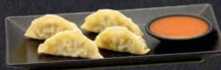
CHICKEN DUMPLINGS gedämpfte Teigtaschen mit Chicken und Dip nach Wahl 4 Stück 6.20