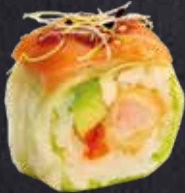
SPRING ROLL DELUXE 8 Stück Reispapier, Eisbergsalat, gebackene Garnele, Avocado, Tobiko, Ponzu-Mayo, on top mit Lachs, Sesam, Teriyakisauce 13.10