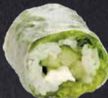
SPRING ROLL KAPPA ✓