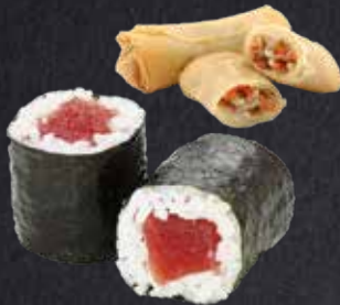
MITTAGSANGEBOT 1 1 Maki Tekka (8 Stück) 8 Frühlingsrollen 8,00

MITTAGSANGEBOTE Montag - Freitag 11.00 - 16.00 Uhr. Nicht erhältlich an gesetzlichen Feiertagen. Mittagsangebote nur für Abholung oder Verzehr im Haus, keine Lieferung.