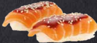
NIGIRI SAKE TERIYAKI Lachs, Teriyakisauce, Sesam 6.50