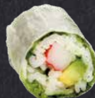
SPRING ROLL SURIMI