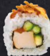
CHICKEN PEANUT ROLL Chicken, Gurke, Erdnussauce, on top mit Röstzwiebeln und Erdnussauce 11.40