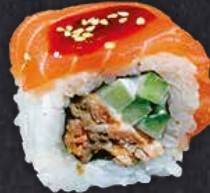
SALMON DELUXE 8 Stück gebratener Lachs, Gurke, Mayo, on top mit Lachs, Sesam und Teriyakisauce 13.50