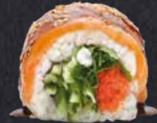
TOBIKO DELUXE 8 Stück Tobiko, Gurke, Koriander, Frischkäse, on top mit Lachs, Teriyakisauce und Sesam 13.50