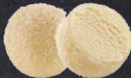
MOCHI KOKOS 3 Stück

Cocos Eis mit Reismehlteig und Kokosraspeln ummantelt.