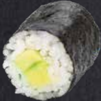
MAKI AVOCADO ✓ Avocado 6.50