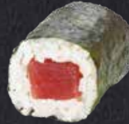
MAKI TEKKA Thunfisch 9.10