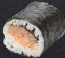
MAKI SALMON gebratener Lachs 7.60