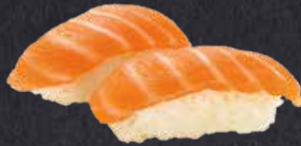
NIGIRI SAKE Lachs 6.10