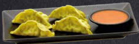
VEGETARISCHE DUMPLINGS gedämpfte vegetarische Teigtaschen und Dip nach Wahl 4 Stück 6.20