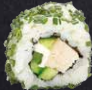
CHICKEN ROLL Chicken, Gurke, Frischkäse 11.10