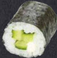
MAKI KAPPA ✓ Gurke, Frischkäse 6.20