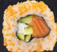
SAKE CHIZU ROLL Lachs, Gurke, Frischkäse 11.40