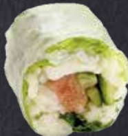
SPRING ROLL TEKKA