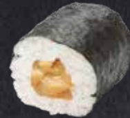
MAKI SURIMI Surimi 6.90