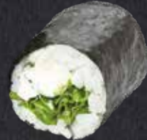
MAKI RUCOLA ✓ Rucola, Frischkäse 6.50