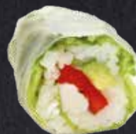
SPRING ROLL VEGGIE ✓