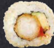
EBI ROLL gebackene Garnele, Avocado, Sweet-Chili-Sauce 12.30