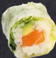
SPRING ROLL SAKE