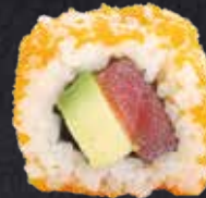
TEKKA ROLL Thunfisch, Avocado 12.30