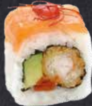
SPICY DELUXE 8 Stück gebackene Garnele, Avocado, Sweet-Chili-Sauce, on top mit Lachs, scharfer Sauce und Chilifäden 15.00